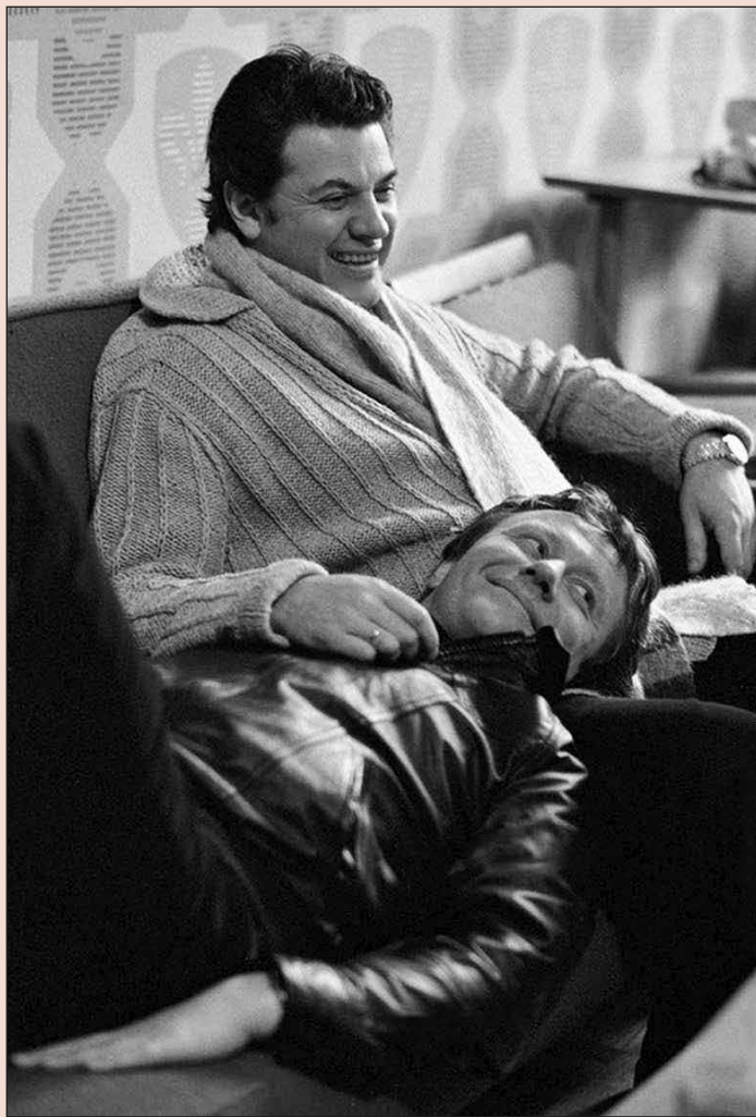
С лучшим другом А. Ширвиндтом