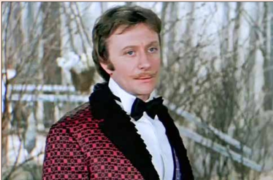
Кадр из к/ф «Обыкновенное чудо» (реж. М. Захаров, 1978)

Элегантность, скромность и огромный талант — вот главное, что привлекало в Андрее Миронове. Он был безупречен как в своих ролях, так