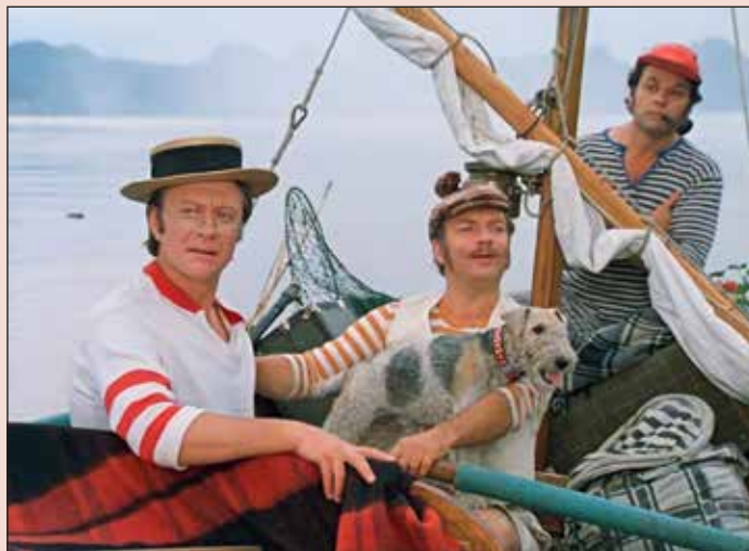
Кадр из к/ф «Трое в лодке, не считая собаки» (реж. Н. Бирман, 1979)

актер умер, не приходя в сознание, от обширного кровоизлияния в мозг. Ему было 46 лет.