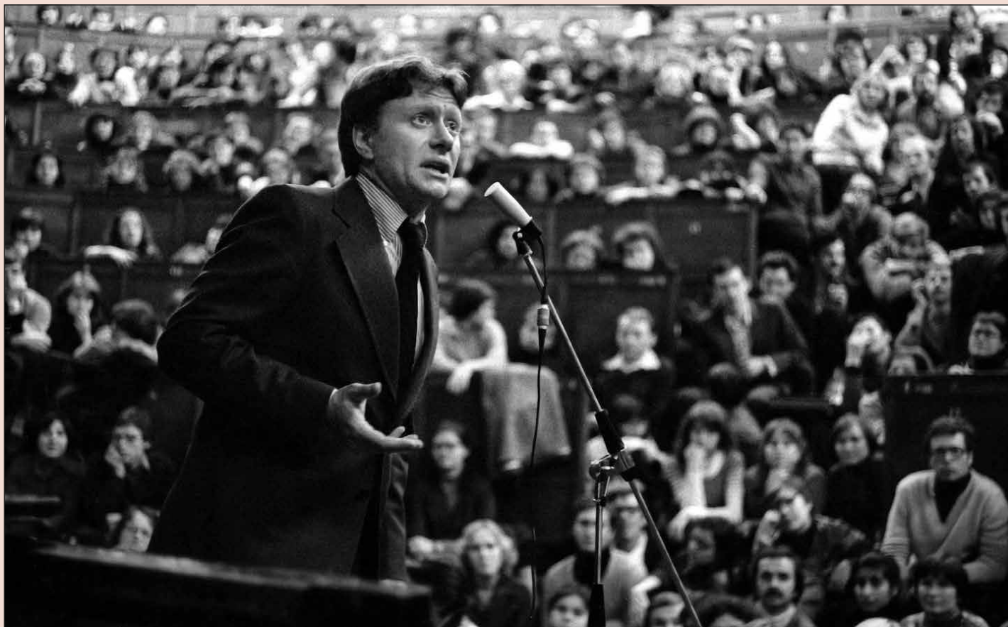
Андрей Миронов на сцене