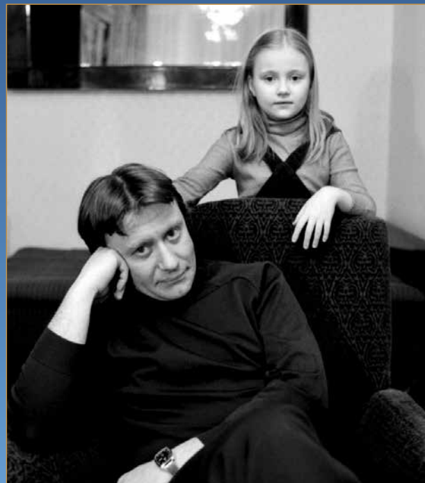
Настоящий Андрей Миронов