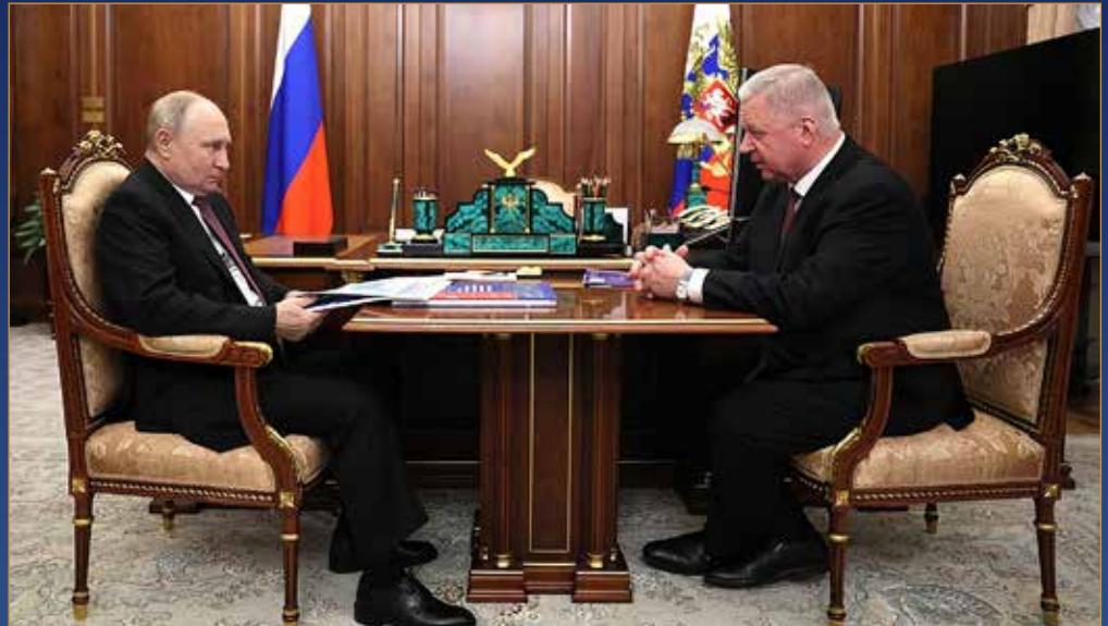
Глава государства провёл рабочую встречу с Председателем ФНПР Михаилом Шмаковым

ТАДЖИКИСТАН: ПРОФСОЮЗЫ В ТРАНС- НАЦИОНАЛЬНЫХ КОМПАНИЯХ