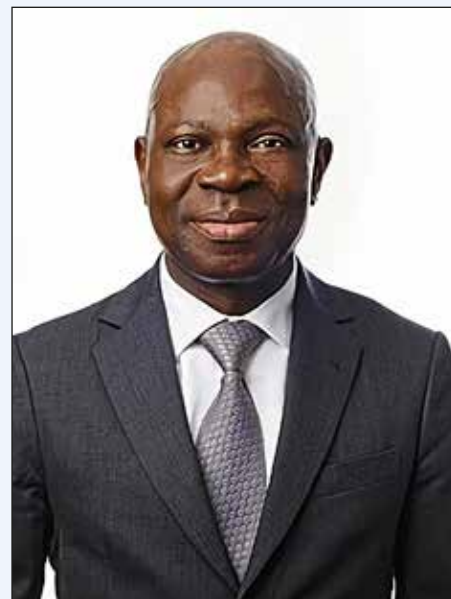
Жильбер Унгбо (Gilbert Houngbo)

По итогам двухдневной дискуссии руководители стран Группы двадцати заявили о приверженности обеспечению устойчивой, качественной, здоровой, безопасной и приносящей доход занятости, преодолению дефицита квалифицированных кадров, проведению открытой, адекватной, устойчиво финансируемой политики в области социальной защиты. Участники саммита утвердили перечень политических приоритетов в целях обеспечения «надлежащей и устойчивой социальной защиты и достойного труда фрилансеров и работников цифровых платформ».