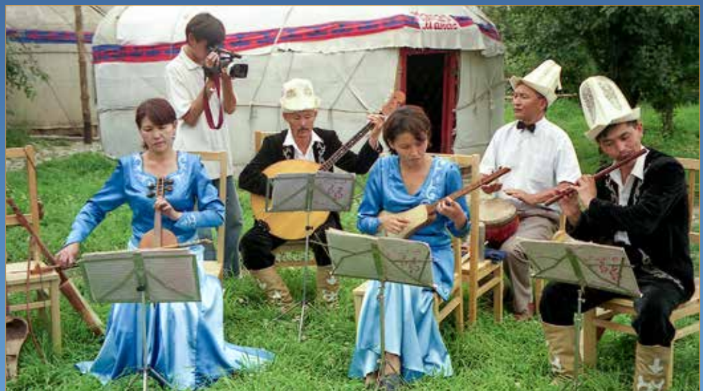
Ренессанс Кыргызской культуры