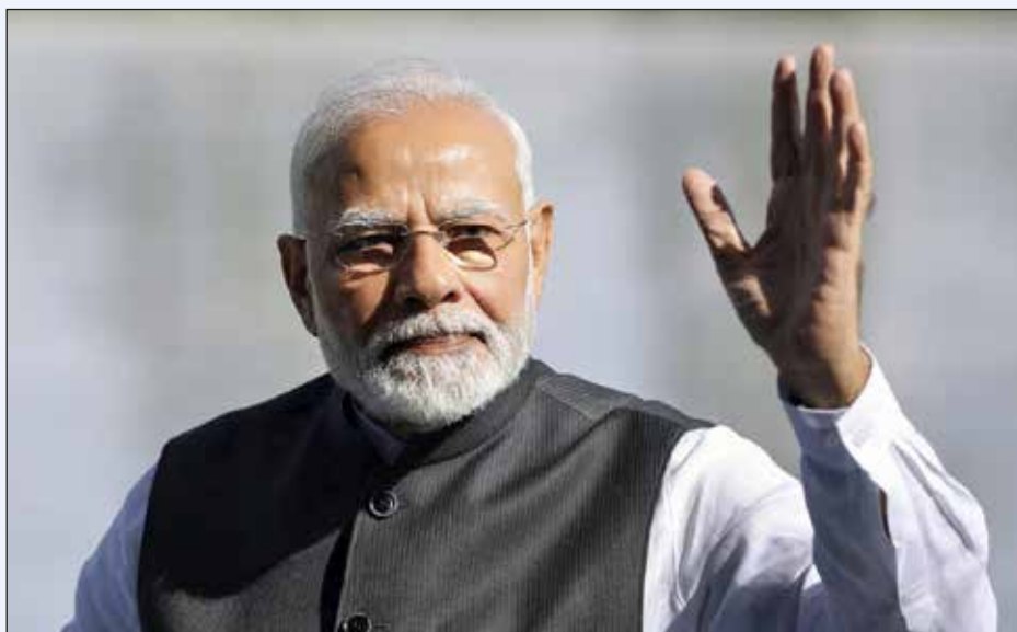
Нарендра Модии, премьер-министр Индии

Саммит стран Группы двадцати прошел в Нью-Дели (Индия) под девизом «Одна Земля, одна семья, одно будущее». В 2024 году председательство в Группе двадцати перешло к Бразилии, которая также примет первое заседание Рабочей группы по вопросам расширения прав и возможностей женщин. ■