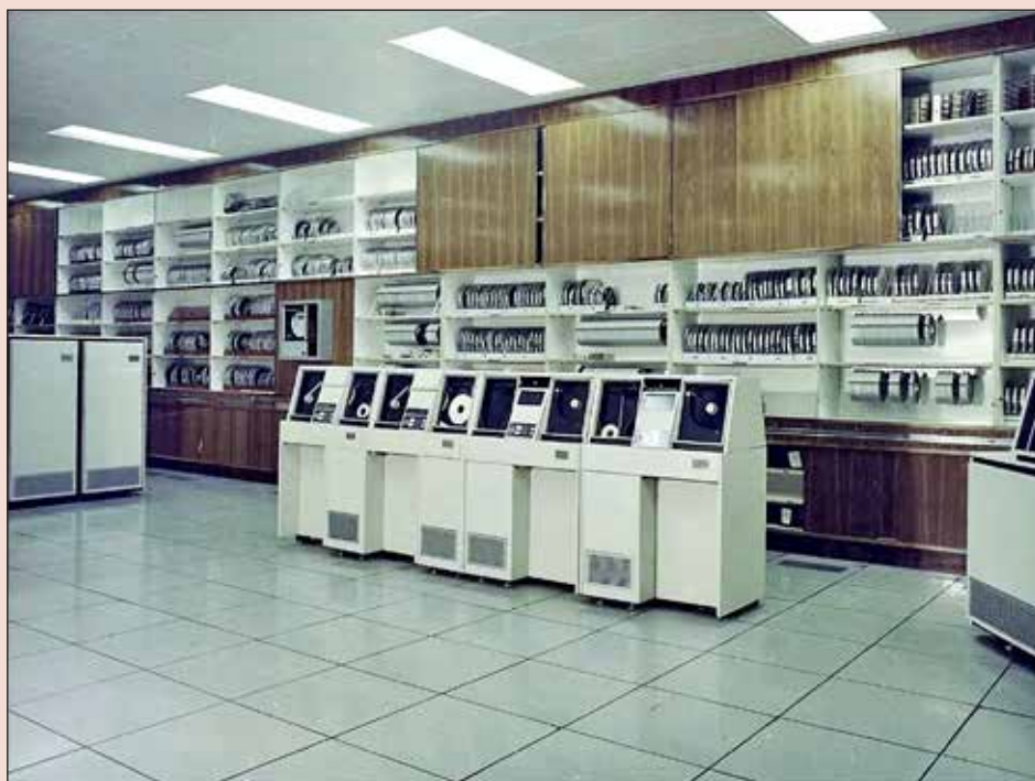
ICL System 4

Рамеев считал, что для создания нового, прорывного поколения ЭВМ нужно объединить работы ученых из разных коллективов. Он верил, что международное сотрудничество продвинет разработки СССР в области ЭВМ на один уровень с IBM и даже вытолкнет часть ее продукции с рынка Восточной